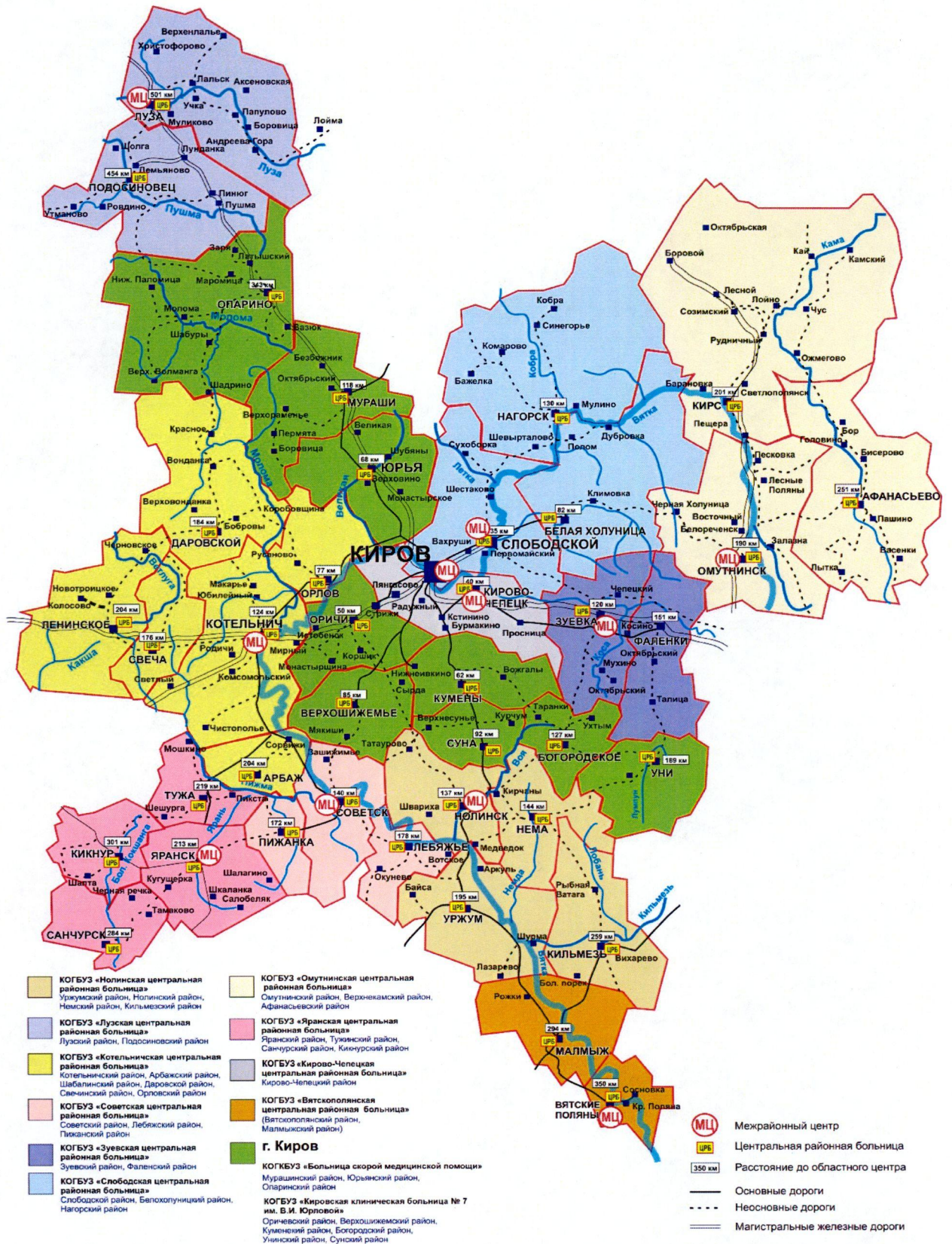
Рис. 2. Схема размещения межрайонных лечебно-диагностических центров Структура службы наблюдения за лицами, занимающимися физической культурой и спортом на территории региона, представлена в таблице 5.