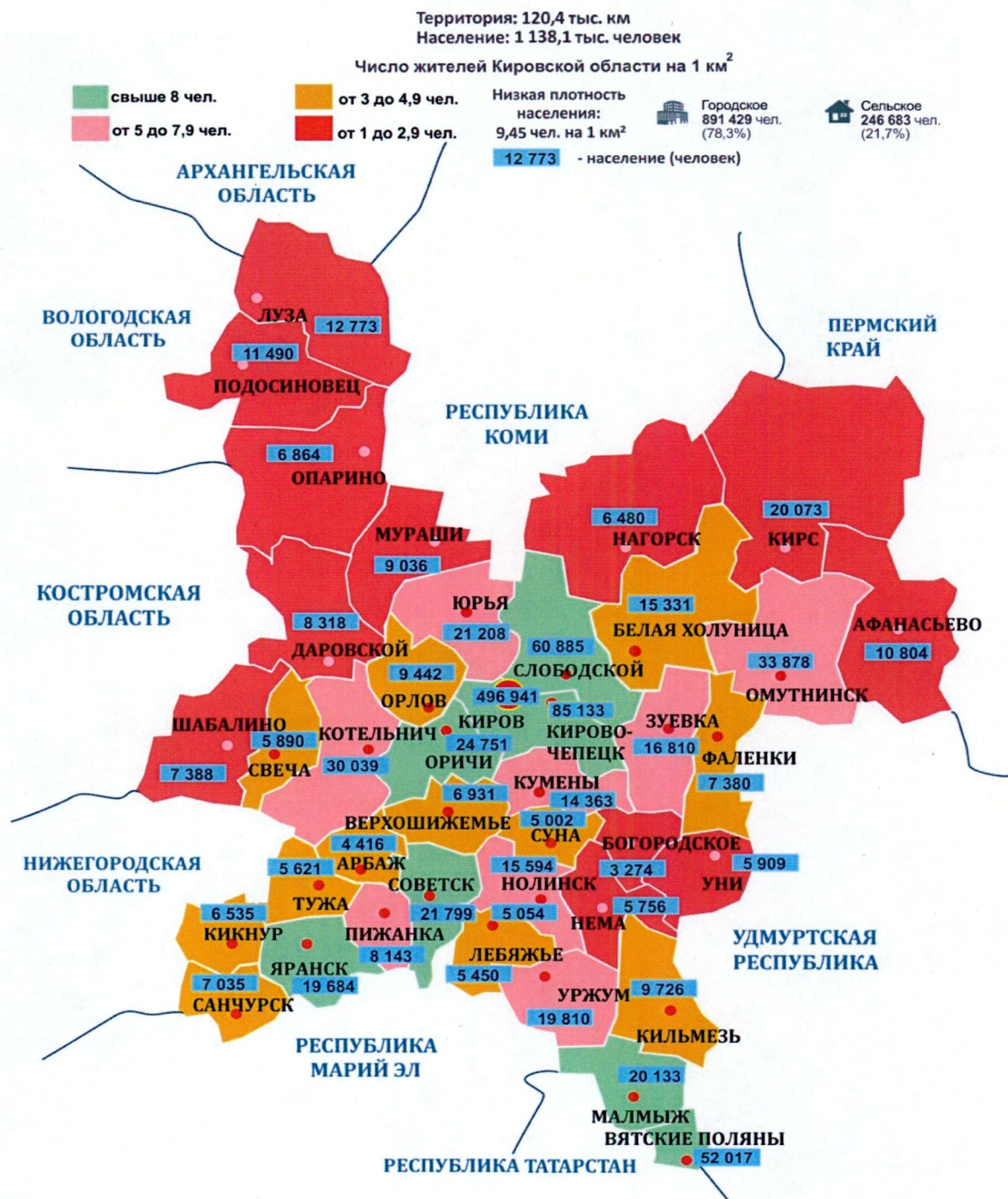
Рис. 1. Численность населения Кировской области

В состав Кировской области входят 294 муниципальных образования, из них: 25 муниципальных районов, 5 городских округов, 14 муниципальных округов, 215 сельских поселений и 34 городских поселения.